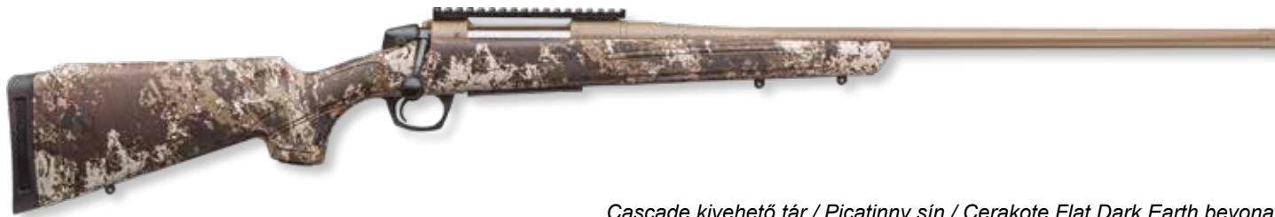
Cascade kivehető tár / Picatinny sín / Cerakote Flat Dark Earth bevonat