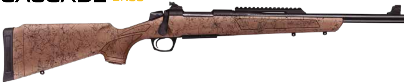
Cascade kivehető tár / Tartalmazza az alapot és a sínt a Scout típusú távcsövekhez / Nyílt Irányzék / Cerakote bevonat